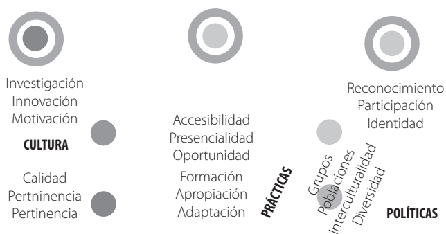
Figura 2. Elementos de la Educación Inclusiva

procesos educativos para el acceso y la apropiación del conocimiento; inversión en la formación y condiciones adecuadas para los docentes; desarrollo de sistemas de apoyo en atención a la diversidad; fortalecimiento de sistemas integrales de protección y promoción social; acceso al uso de las TIC; aumento de mayor inversión y hacer más equitativo el gasto público en educación y adelanto en sistemas de información desagregada por factores de inclusión (2014). Por lo tanto, todo está acorde a las necesidades del contexto y esto es, en principio, la conformación de equipos que identifiquen las necesidades para dar inicio, no precisamente desde lo más difícil, más vale de aquellos pequeños elementos considerados que pueden ir modificando.