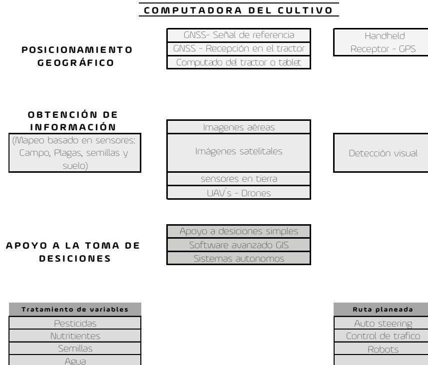
Figura 1. Sistemas y sensores en la agricultura de precisión

como herramienta de gestión, la agricultura de precisión consta de cinco elementos para el desarrollo de tareas: geoposicionamiento GPS, recopilación de información, soporte de decisiones, tratamiento de tasas variable y mapeo de rendimiento (Pedersen, 2017). La figura 1 ilustra la relación entre diferentes sistemas y sensores en la agricultura de precisión al compaginar sistemas de geoposicionamiento con sistemas de sensores de apoyo a la toma de decisiones y aplicaciones de tasas variables y planeación de rutas.